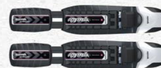
Rottefella BC Manual Prix François Sports CHF 100.-

Elle regroupe toutes les fixations plus légères destinées aux skieurs qui se déplaceront dans des terrains vallonnés et peu accidentés. En effet, la tenue est moindre pour des descentes engagées, mais offre une excellente dynamique pour les parties plus planes et sera suffisante pour la plupart des combes Jurassiennes. Elles seront couplées avec des skis plutôt légers et étroits afin d'avoir un set cohérent.