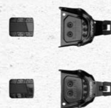
Rottefella Super Telemark Prix François Sports CHF 100.-

Les fixations pour les solides ! En effet, la plupart des chaussures compatibles avec cette norme sont plus rigides et offrent donc une bien meilleure stabilité. Ces fixations sont donc préconisées à la fois pour les skieurs qui arpentent des secteurs un peu plus raides, pour les télémarqueurs ambitieux ou aguerris ou tout simplement à une personne qui recherche plus de sécurité à la descente... Au final, il y en aura pour tous les goûts, mais avec un matériel un peu plus lourd qu'avec les fixations BC puisqu'elles se destinent à des skis plus larges.