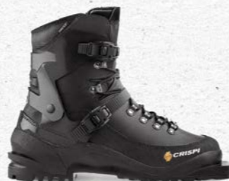
Crispi Svartjsen 75mm Prix François Sports CHF 360.-