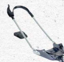
Voilé 3 Pin Cable Traverse Prix François Sports CHF 200.-