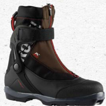
Rossignol BCX 10 Prix François Sports CHF 240.-