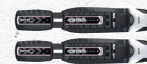
Rottefella BC Magnum Prix François Sports CHF 100.-