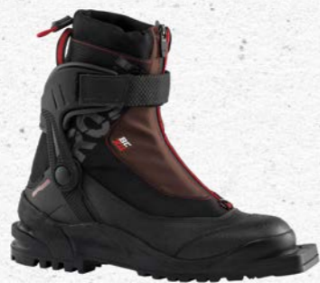
Rossignol BCX 11 Prix François Sports CHF 310.-

Ces modèles de chez Rossignol sont bien connus des adeptes de la rando nordique pour leur confort et leur facilité de chaussage. Un chausson moelleux et douillet qui saura vous tenir au chaud même dans des conditions météo difficiles. Sa guêtre protectrice vous protégera également de toute entrée de neige à l'intérieur des chaussures. Equipées d'un pare pierre et d'une tige plastique articulée au niveau de la cheville, elles vous garantiront solidité et stabilité tout au long de vos sorties.