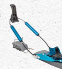
Voilé Hardwire 3 Pin Prix François Sports CHF 280.-