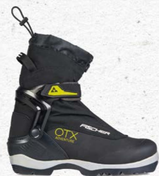
Fischer OTX Adventure BC Prix François Sports CHF 190.-

La petite légère de notre assortiment ; plutôt destinée à des tracés peu techniques sans grandes difficultés. La combe des Amburnex parait être un de ses spots de prédilection. Confortable et pratique avec sa guêtre qui vous protégera de la neige fraîche, elle offrira la tenue nécessaire pour vous déplacer sur de longues distances !