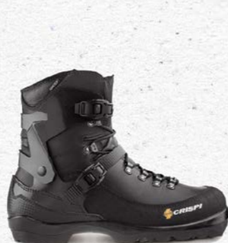
Crispi Svartjsen BC Prix François Sports CHF 360.-

Fabriquées au pied des Alpes italiennes, ces chaussures Crispi figurent parmi les meilleures de la discipline. Chaussures de haute qualité élaborées à partir de cuir pleine fleur, elles vous séduiront par leur confort et leur solidité. Dotées d'un large pare-pierre, d'une coque articulée en composite et de boucles micrométriques, elles vous garantiront une excellente tenue même dans des descentes engagées. Equipées d'une membrane Gore-tex, vous resterez les pieds bien au sec même sur des raids de plusieurs jours.